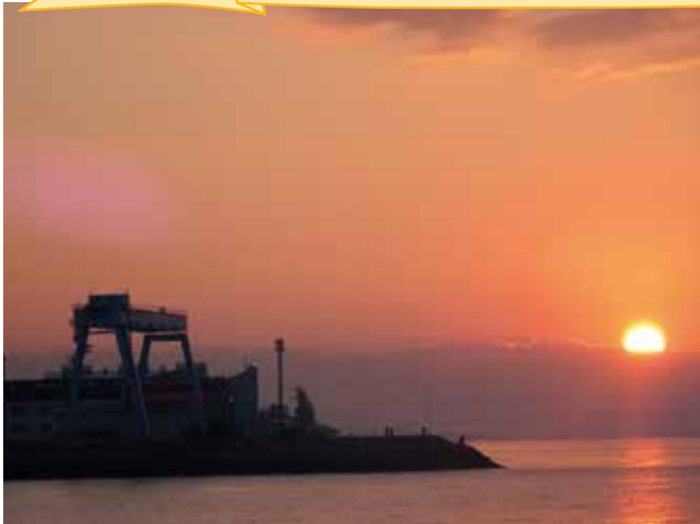
▲第一人工島から望む初日の出