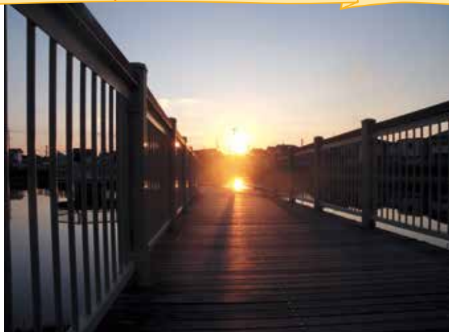
▲狐狸ヶ池に沈む夕日