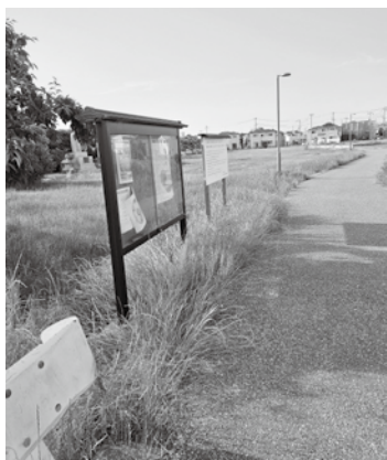
整備が期待される大池広場

答 フリースペースを整備して開放しているなど、意欲的に活動して、事業も計画性をもって実施しており期待している。