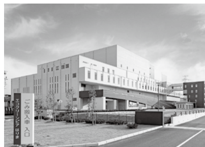
エコクリーンピアはりま（高砂市）