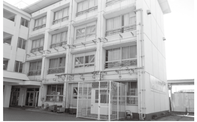
快適な学校生活を

播磨南中学校西校舎は、昭和54年3月に竣工しました。45年経過し、経年劣化しているため大規模改造を、3か年かけて施行します。1年目である令和6年度は、主にトイレ改修工事を行います。