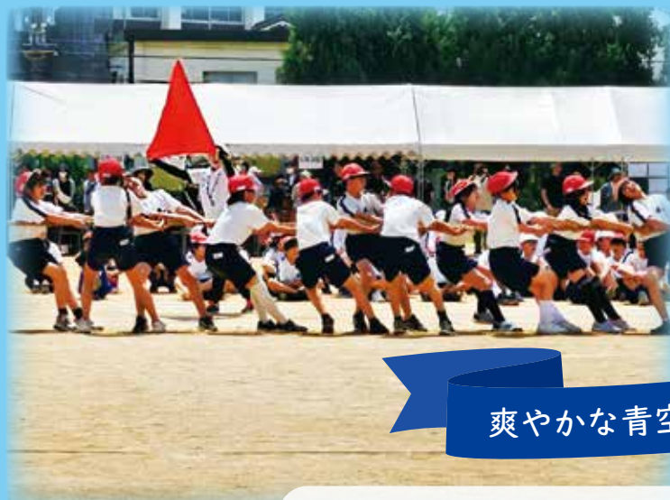
爽やかな青空の下 歓声響く