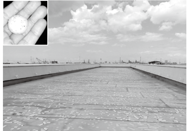
屋上の防水シートが大きく破損

4月16日夜に発生した こうひょう 降雹により、町道播磨町駅地下道の上屋防水シートが破損し、雨漏りが生じています。また、播磨幼稚園、蓮池小学校、播磨西小学校、播磨中学校の校舎屋上防水シートが破損したため、改修工事を実施する補正予算を可決しました。