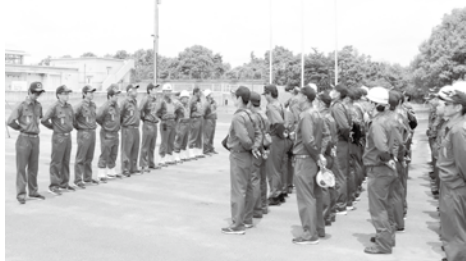
訓練を重ねる消防団

答 地元自治会から抜け道として相談を受けた箇所は町内に8ヶ所ある。企業・自治会・住民・行政がそれぞれ考え、地道に交通ルールの順守や地域安全について啓発し、関係機関や警察と連携して対策を進めていく。