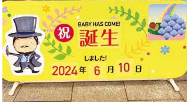
かわいい家族が増えました（役場1階）