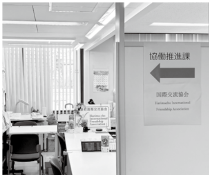
国際交流協会（協働推進課内）