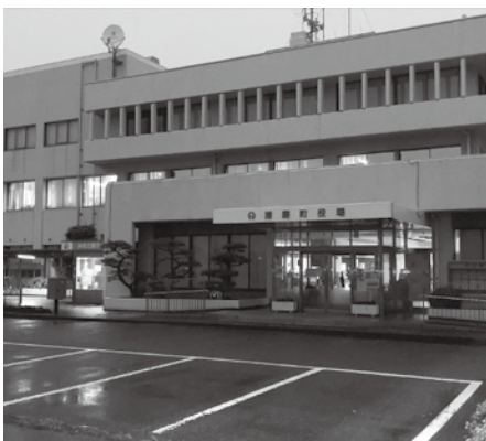
庁舎には夜遅くまで明かりが

答 職員は、住民福祉のために昼夜働いているが、職員の健康管理には一層注力したい。長時間労働職員の意識改革、仕事のやり方を変えることが大切であるので、まちづくりの発展のため、職員の働き方を変える。