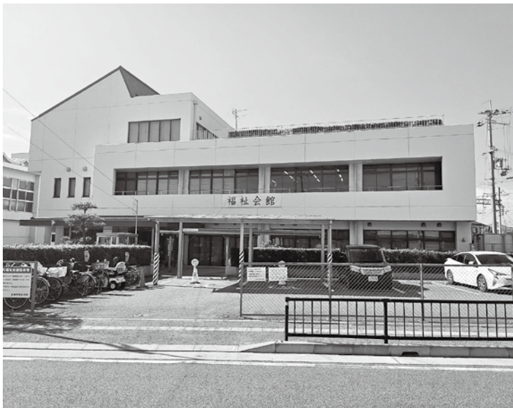
センター設置予定の福祉会館

令和6年度から始まる「第7期播磨町障害福祉計画」において、令和7年度末までに児童発達支援センターの設置と、障害児の地域社会への参加・包容を推進する体制