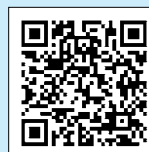
調整給付金 (播磨町 HP)

新たに住民税非課税・均等割のみ課税世帯に10万円を支給します。 6月から7月上旬に確認書を送付し、順次振り込みを行います。 申請書の提出期限は、10月31日までです。