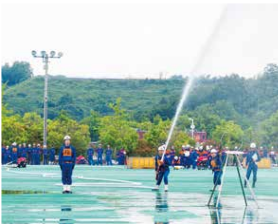
「放水 はじめ！」 兵庫県広域防災センター（三木市）