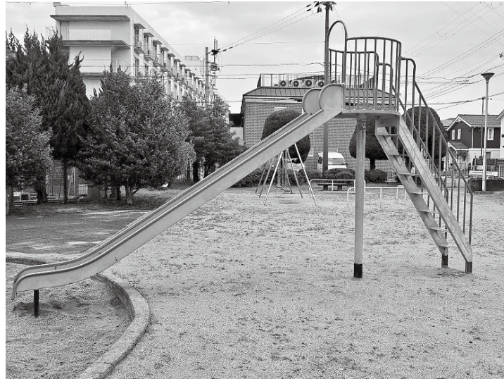
修繕されキレイになったすべり台（瓜生公園）