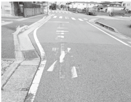
分からない!? 「止まれ」標示

問 令和6年4月16日夜に発生した降雹により、大きな被害が公共施設や一般住宅に出た。公共施設の被害調査は早急に進められたが、一般住宅の被害調査は行わないのか。 答 一般家庭の調査は実施しておらず、被害については自助で対応すべきものと判断したが、非常に心苦しく感じている。