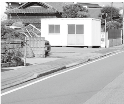
凹凸が多く通行しにくい歩道