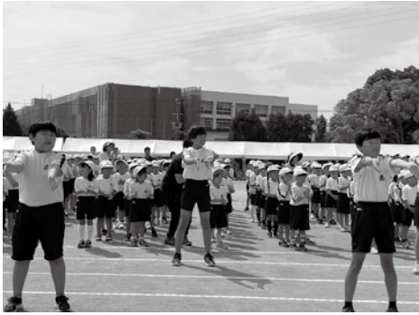
元気いっぱい応援合戦「フレーフレー！」

問 平成28年に差別を解消するために「障害者差別解消法」「ヘイトスピーチ解消法」「部落差別解消推進法」が施行され、共通している