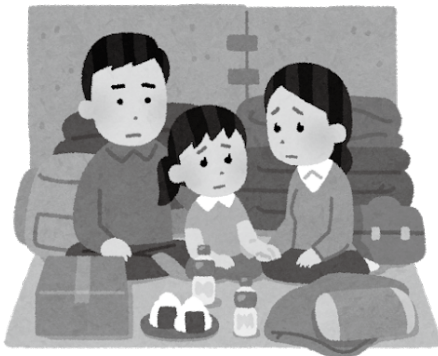
日頃からの備えが大事

答 小学校高学年と中学生には情報モラル教育や、人としての生き方についての学習を実施している。福祉会館においては、若年層を含めた全住民を対象に、生活困窮や就労の相談について対応している。