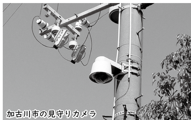
加古川市の見守りカメラ

住民の安全・安心のまちづくりのため、通学路など日常生活における子どもの安全確保強化や、主要なゴミステーション周辺などを中心に250台設置します。