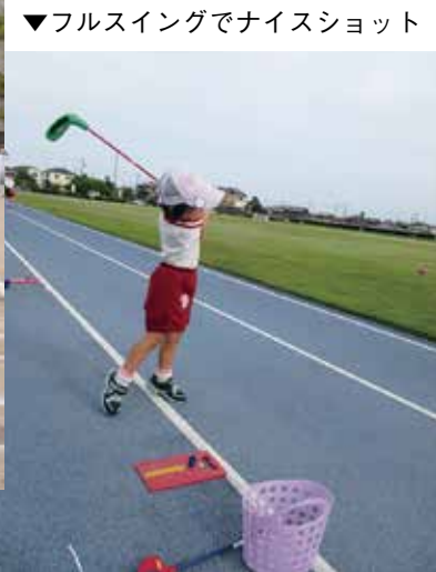
▼フルスイングでナイスショット