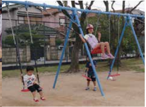
▲風をきってピース ▼コミセン運動会で車イス体験