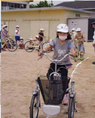
▲自転車も安全運転で