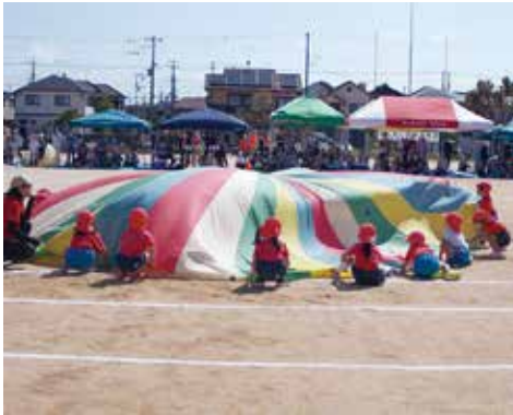
▲みんなで気持ちを一つに