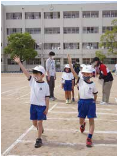
▲交通ルールをしっかりと確認