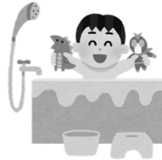
▲私たちの生活に欠かせない水道水

問 水道料金の改定について現在、上下水道運営委員会が議論されている。単身世帯など使用料の少ない世帯の負担が大きくなりすぎないように検討すべきでは。 答 水道事業は多くの施設を抱えていることから固定費の割合が高く、基本料金の割合を高くせざるを得ない状況である。使用水量が少ない世帯への負担増の抑制などを検討している。 問 運営委員会で示されている案では、一般家庭で主に使用する口径20ミリメートル以下の基本料