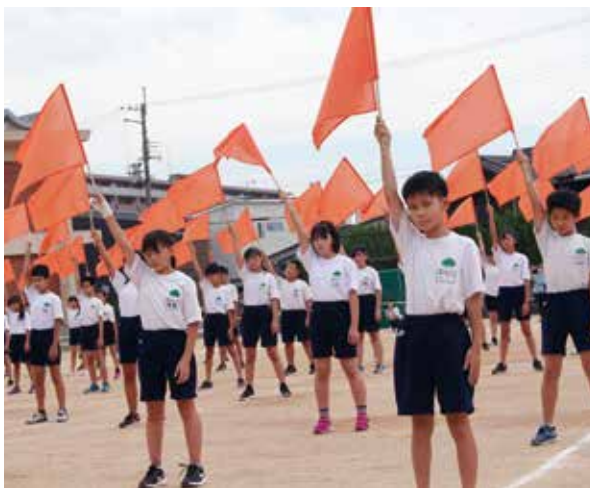
▲ビタミンカラーで元気いっぱい