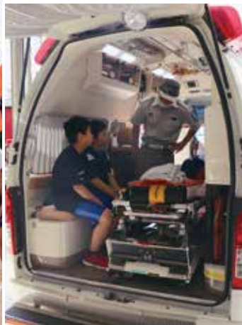
▲救急車の中で興味津々