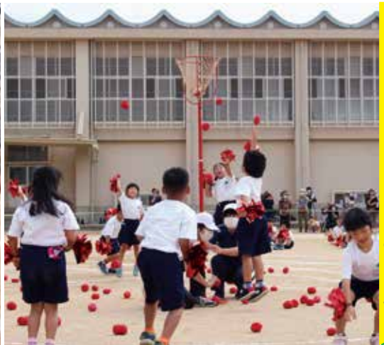
▲子どもも玉もはずんで