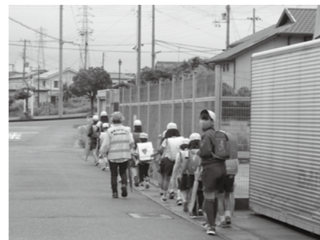
▲学校再開後、元気に登校する児童

問 3月に及ぶ臨時休校の長期化により、子供の心理状態には、どのような課題が想定されるか。 答 休校中は行動が制限され、不安や悩み、ストレスを感じていたが、久しぶりの登校で友人との再会が嬉しいなどの感想を聞いている。 問 休校中の子供たちに対する教職員の対応は。 答 担任が1週間に1回から2回程度、電話などで連絡し、児童生徒の健康状態や学習の進捗状況を把握し、悩みや相談などに対応している。