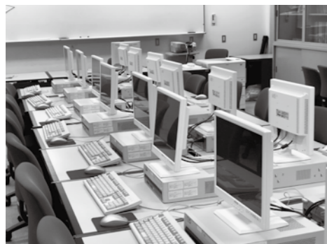
▲全世代が利用できるネット環境を

問 来年度より小中学校に端末機器が導入されるが、ICTの利用に関して情報格差が懸念される。様々な情報を検索するためにも、全世代が利用できる環境整備が必要では。 答 あらゆる方が利用できるネット環境は望ましい。災害時にも活用できる環境整備は、安全対策、設置場所、必要経費などを考慮し慎重に検討していく。 問 システムエンジニアなどを臨時で雇用し、全住民向けの講座などを行うというICTに強い町づくりに向けての考えは。