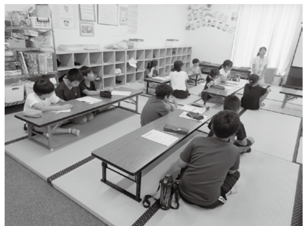
▲学童保育で宿題も

問 住民からの声を受けて、対象を拡大するのか。 答 住民から要望があり実施する。阪神間の学童保育所では既に実施しているところもあり、近隣市町では初めての試みである。