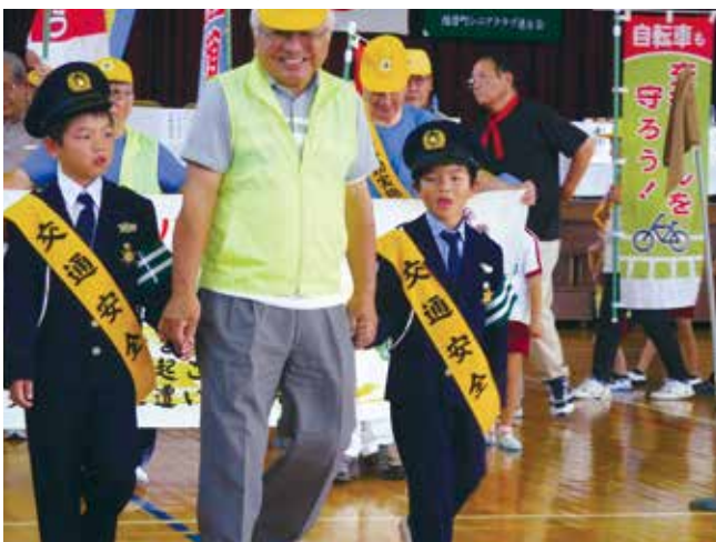
▲みんなで交通安全を