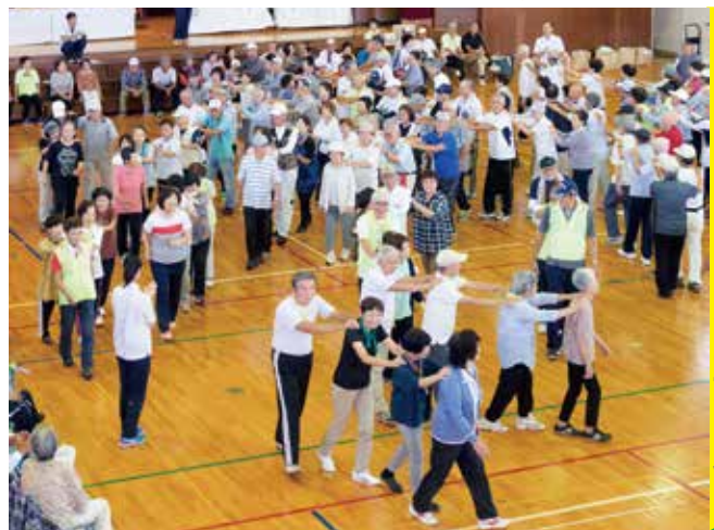
▲元気いっぱい！シニアの運動会