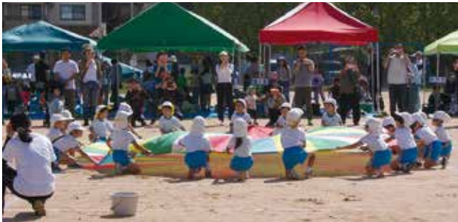
▲みんな見てね（野添コミセン運動会）