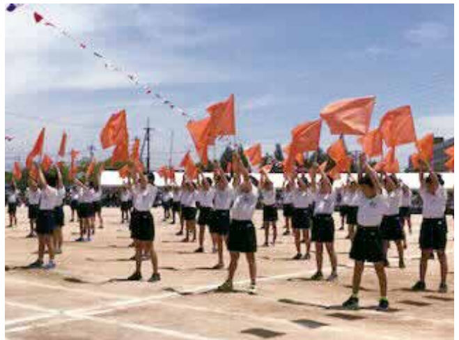
▲青空にはためく（播磨南小学校運動会）