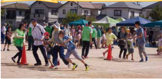
▲急いで回って！（野添コミセン運動会）