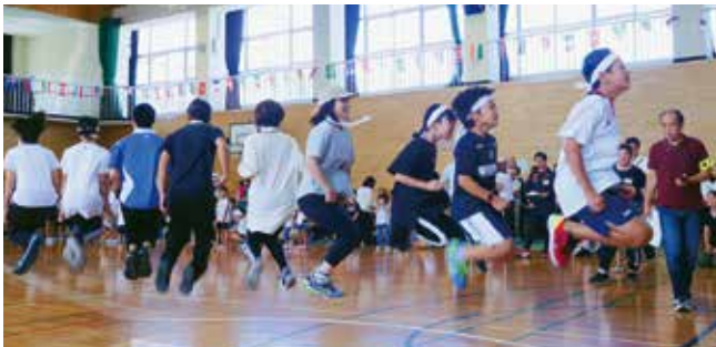
▲みんなで息を合わせて！（東部コミセン運動会）