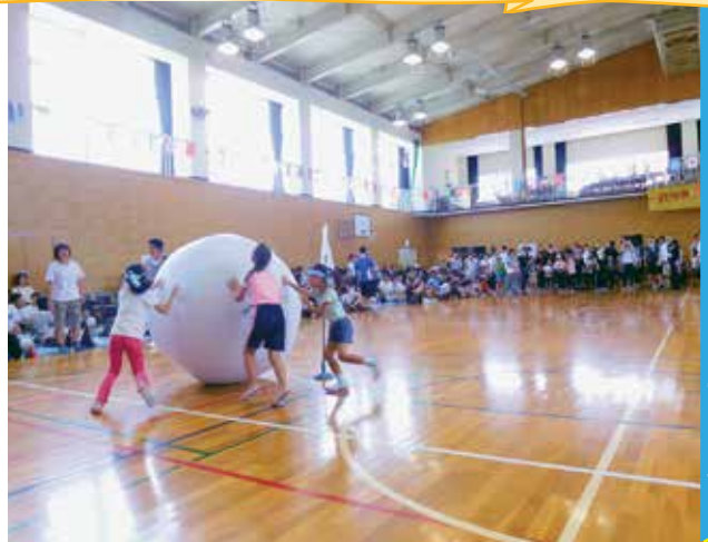
▲力を合わせて！（東部コミセン運動会）