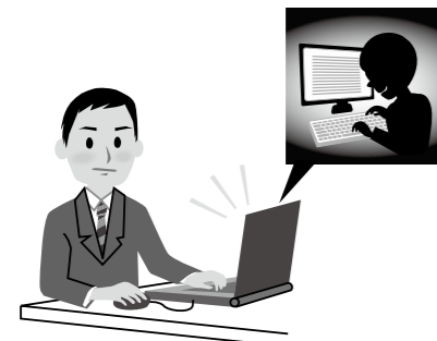
▲人権を侵害する悪質な書き込みを監視

問 最近、インターネットを使用したプライバシーの侵害や差別情報の流布など、インターネット掲示板への悪質な差別書き込み、人を誹謗中傷する書き込みなどの新たな人権侵害が増加している。県は、今年度よりインターネットのモニタリング（監視）を開始する中、県下の自治体にモニタリングについての研修会を実施し、モニタリングの実施を呼びかけている。本町においてもモニタリングを実施し、町民に係る誹謗中傷や差別書き込みを監視して、悪質な書き込みに対し削除要請をする