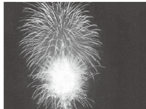
▲町制施行30周年を記念した花火

問 2002年の花火大会を最後に開催していない理由は。 答 年々見物人の数が増加することで、安全面での対応に限界があるため開催していない。 問 花火大会を開催してほしいという住民の声もあるが、どう思うか。 答 これまで、開催してほしいという意見は、ほとんど聞いていない。 問 安全面を確保できた場合、今後開催する意思はあるのか。 答 安全面を確保できる保証がないため、開催する意思はない。