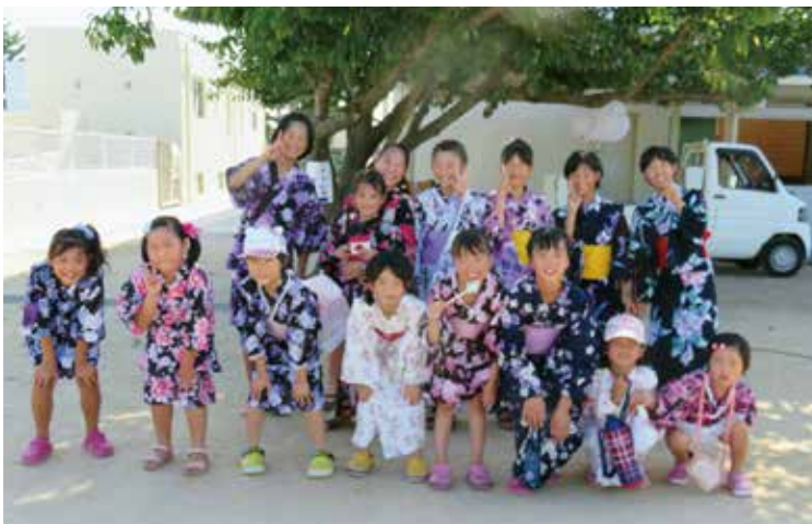
▲夏だ！ 浴衣だ！ お祭りだ！ (蓮池小)