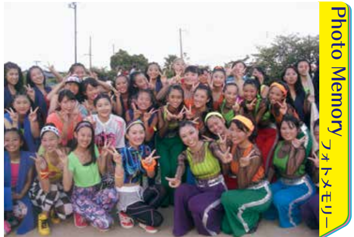
▲仲間と一緒に精一杯！ (のぞえ夏まつり)