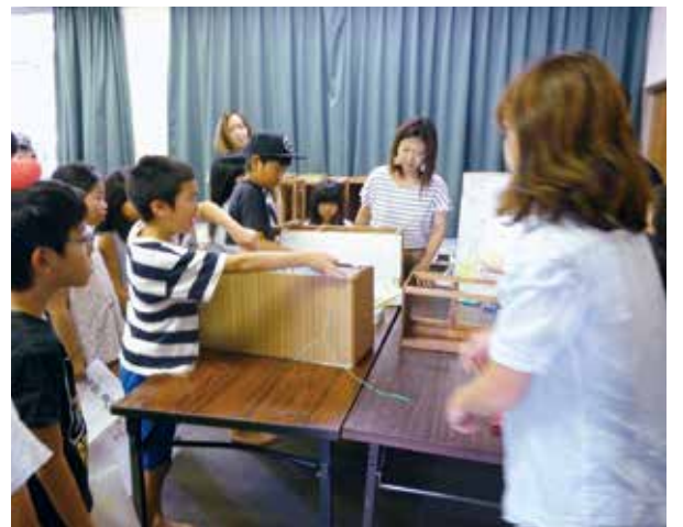
▲上手に貼れるかな？ (古田西公民館)