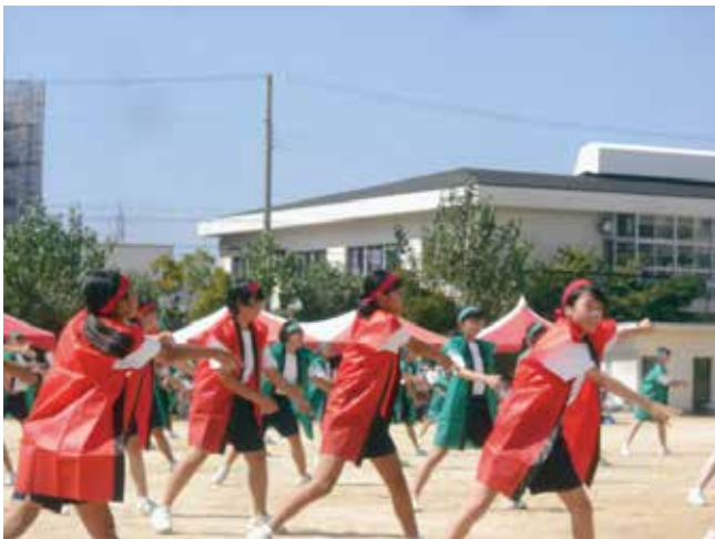
▲ヤーレン ソーラン ソーラン♪ (南中)