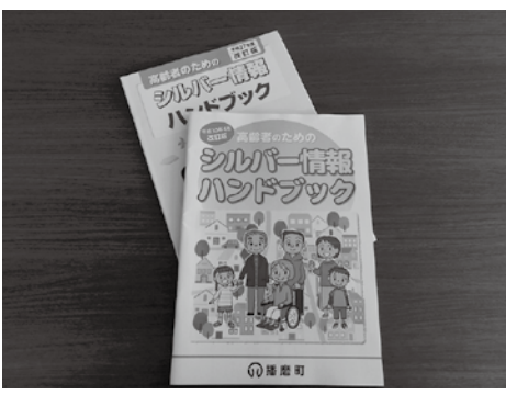
▲そばに置いて活用してほしい

問 以前は介護保険利用料が自己負担（1割）の目安で書かれていた。今回、サービス費用（全額）を書いた意図は。 答 現在、所得に応じて1割、2割、3割負担の3段階となっている。全ての金額を記載すると分かりづらいため、10割の金額を記載した。10割の金額から負担割合に応じて計算していただくようにしている。