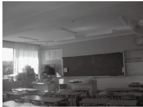
▲1日も早くエアコン設置を

問 熱中症など命に関わる危険な暑さで、小・中学校にエアコン設置の声が全国的に広がっている。教室の温度は測定しているのか。 答 校内の温度は測定しており、最高室温は35・2度であった。 問 国が定めた教室内の室温の基準は。 答 基準は17度から28度である。 問 来年度計画している小学校のエアコン設置時期を6月末までにできないか。 答 現在、実施設計を行