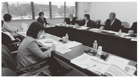
▲富士見市の取り組みを調査

問 業務に当たる職員の モチベーションを上げる ために、どのような対策 を講じるのか。 答 担当職員への支援が きちんと行き届くような 形で、債権対策会議を進 める。町一丸となって取 り組む姿勢を示し、やる 気を引き出す。