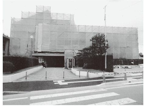
▲改修工事中の福祉会館

問 本町の各建設工事に おいて監理業務を工事設 計業者と随意契約してい る。その結果として例外 もあるが、多くの工事で 設計金額を上回る委託料 となっている。競争原理 が働かず、他町と比較す ると正反対の現象が起 こっており、見直しする べきでは。設計業者に監 理業務も委託する理由 は。また委託料の妥当性 は。