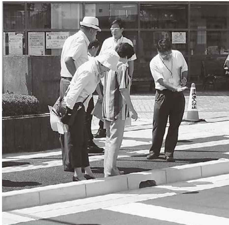
▲歩道（町道播磨町駅前線）の現地視察

答 所有者を調査のうえ、所有者に対して適正管理を依頼している。要望があれば、2回以上依頼文を郵送する場合もある。