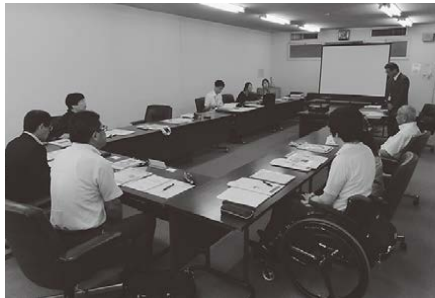
▲山口県宇部市への視察

3カ月以上滞納した場合は、学期末の保護者懇談会時に納付交渉を行う。納付意思のない場合は給食を停止する処置をとっている。