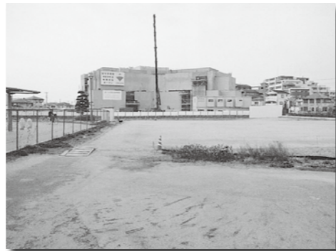
▲建設中のはりま病院と未整備地

問 はりま病院のオープンは平成23年の春と聞いているが、変更はないか。 答 院内薬局を設置することとなり準備を要するので、2、3カ月遅れる見込みとのことである。 問 旧アルペン跡地の未整備面積は。また、その土地についても現在、はりま病院と係争中のようなことは起こり得ると思うが。 答 利用面積としては5100㎡程度である。地中の状況は完全に把握できないため、廃棄物など