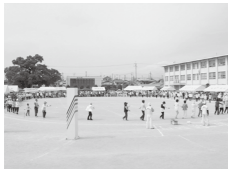
▲シニアクラブ連合会の運動会

問 34自治会で実施されている「いきいきサロン」の現状は、平成13年度当初の主旨と異なっていないか。 答 現在34自治会で意欲的に取り組んでいる。今後、当初の主旨を見直すことにより、より充実したものになるよう促したい。さらに、40自治会での実施を目指したい。 問 「シニアクラブ」の現状は、自治会によって温度差があると思われるが。 答 「シニアクラブ」は現在22自治会で結成され