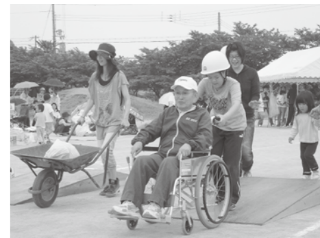
▲ふれあい町民運動会での震災予知・体験競技(蓮池小)

問 災害時避難場所である学校施設の防災拠点作りをどこまで進めているのか。 答 小中学校、東はりま特別支援学校には防災倉庫を設置し、毛布、担架救急箱、ヘルメット、消火バケツ、ボール、スコップなどの防災資機材を置いている。 防災行政無線の整備により、アンサーバック付きの屋外拡声子局で親局と通信可能。 問 小中学校には自家発電機はなく、町内には移動式が5台あるのみ。避難者、避難場所の想定数を考えると不足では。 答 地域防災計画の見直しにより、備蓄計画などを改めて検討していく。町が主導的に行うことは考えていない。 問 地域防災計画に、避難所運営や要援護者への対応など、女性の意見を反映できる仕組みが必要である。 答 3人の女性委員がいる。先月末にプロポーザル(目的に合致した企画・提案能力のある者を選ぶ方式)の決定により職員によるプロジェクトチーム方式の提案があり、各グループから女性の参加を考えていきたい。 問 津波発生時の民間施設避難所の進捗状況は。 答 一つは承諾があり締結に向け協議中。2施設については総会の結果を待っている状況である。