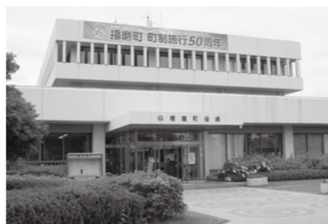
▲情報公開義務条例で開かれた行政に

問 町の運営の基本方針や施策の確かな判断を行うのが、最高意思決定機関の庁議と考えるが。 答 庁議は「町長の意思決定について、助言、審議などの機能」を有するものであり、最終的な意思決定は町長が行う。 問 情報公開と住民参加は両輪であり、重要施策の決定がなされる庁議を公表し、開かれた行政を目指すべきではないのか。 答 政策形式に関わるものもあり、公表はしない。 問 庁議に諮り、5月臨時会で上程された議案で大阪高裁判決の、職権乱用として違法性を示す担当理事の報告に反し町長の「違法性はない」の故意に誤った発言は、地方公務員法第33条の信用失墜行為にあたるのでは。 答 同規定に該当しない。 問 町が被告であるが、町長の職権乱用で賠償責任が発生し、町は多大な損害を受けることになる。国家賠償法第1条第2項の該当により、町は町長に対し求償権がある。町長の判断は。 答 過失などには該当しないものである。 職員昇格は公正であるか 三村 規則などに基づき実施 問 人材育成の観点から勤務成績が良好な職員が昇格すべきと考えるが、若い職員から不信感を抱くような管理職の一律的な昇格があったのでは。 答 職員の給与に関する規則などの規定に基づき実施している。