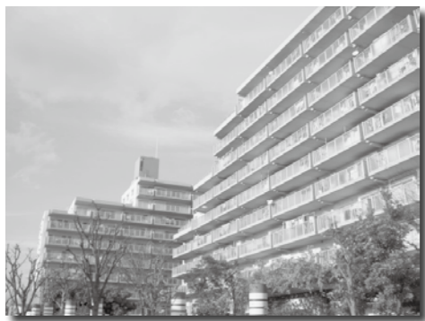
▲津波から命を守るため民間マンションへの協力依頼を

問 最大クラスの津波を想定し、避難用のビルや通路を整備すべきと考えますが、避難ビルの指定は。 答 民間のマンションはセキユリテイラーの面から指定は困難と考えるが、今後、協力要請をしたい。 問 津波関係の専門家に調査を依頼し、海底地震計の充実を。 答 中央防災会議の検討結果を受けた国の整備状況も注視したい。 問 海抜を示す標識を身近な場所に設置し、避難経路の徹底を。 答 播磨町地域防災計画