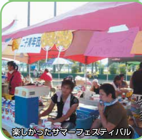
楽しかったサマーフェスティバル

高齢者や障がい者がサマーフェスティバルに参加しやすくなるようNPO法人との検討は。 今後、補助をしていく上でそういったことも検討していきたい。