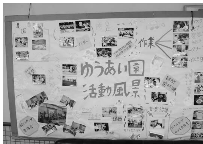
▲障がい者の自立を支援する授産施設の活動

いろいろ検討する上で平面交差に決定し、駅南側周辺整備事業の一環としている。しかし、平成21年度中の実施は困難であり、新たな事業Xニユウの検討が必要と考えます。