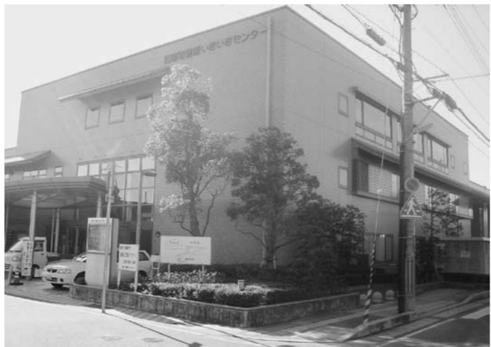
▲指定管理者制度による健康いきいきセンター

播磨町の多くの施設において指定管理者制度が導入され、21年3月末に3年間の指定期間が満了する。向こう5年間の管理者選定の時期を迎えている。制度の目的が経費の節減も含めてどの程度達成されているのか、また課題は。