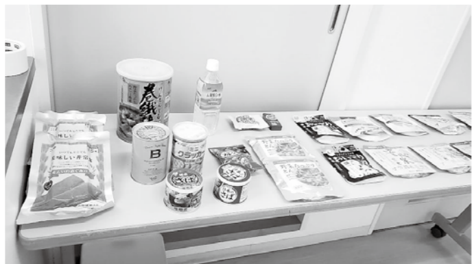
▲おいしくなった備蓄食（兵庫県防災士会 東播エリア）