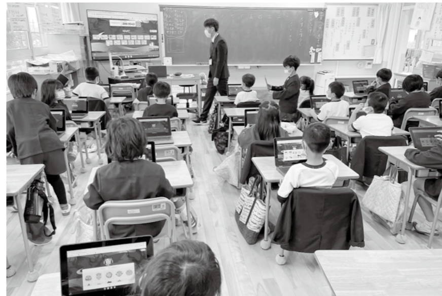
▲メンテナンスでタブレットがより使いやすく

ワクチン接種の期間延長 新型コロナウイルス感染症のワクチンについて、特例臨時接種の実施期間が令和6年3月まで延長されたことに伴い、接種費用を増額補正しました。接種体制について、集団接種は、はりま病院での実施を予定しています。また、より一層個別接種を推進し、各医療機関と連携して実施するため、新たに必要となる経費について増額補正しました。