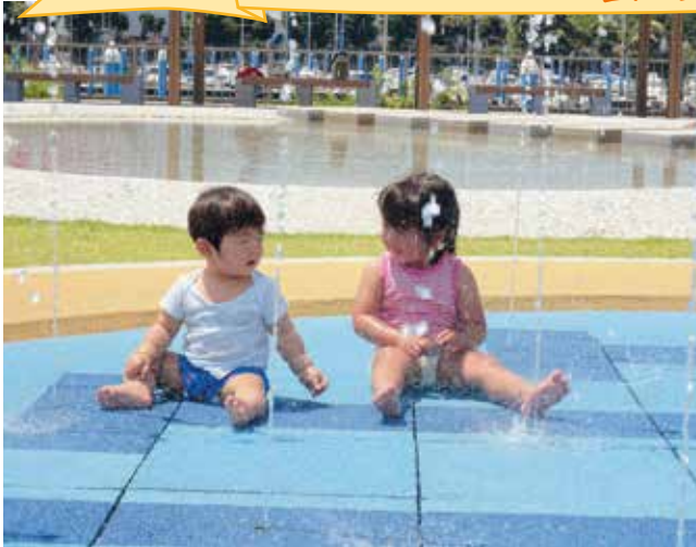
▲見つめあう二人 (うみえーる広場)