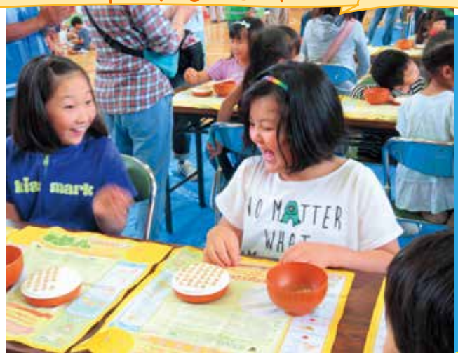
▲やったー!できたよ豆つかみ (ふれあい運動会)