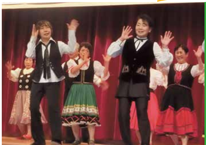
▲ことぶき大学大学祭「フォークダンスクラブ」