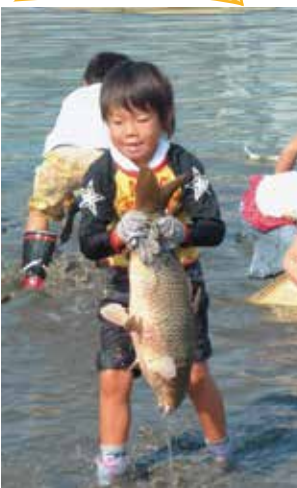
▲魚のつかみ取り大会（北池）