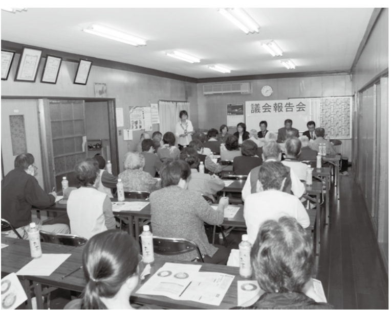
▲第10回議会報告会(土山駅前公民館)

※オストメイトとは、がんや事故などにより消化管や尿管が損なわれたため、腹部などに排泄のための開口部(ストーマ)を造設した人のこと。