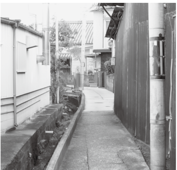
▲土山駅北地区の狭あい道路

床面積が300㎡を超える場合は設置義務がある。それ以下は自治会の判断による。工費が100万円を超える場合は、全額の6分の1を町が補助する。