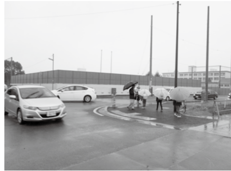
▲町道浜幹線との交差点を通過する児童たち

問 役場前交差点より東側の供用を開始する町道浜幹線道路の交通安全確保と、より安心で快適な整備を求め信号機の設置を。 答 以前より南小・中・高の児童生徒の横断が特に多い町道古宮土山線との交差点は、公安委員会に地元や学校関係者の要望書の提出など、再三にわたり協議をかさねてきた結果、今年度末までに、信号機が設置される。交通指導員の体制は、増員は出来ないが、