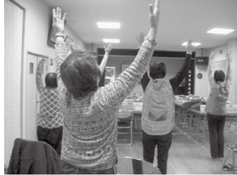
▲100歳体操で健康づくり(二子北公民館)

問 「国保税が高くて払えない」との声がある。滞納繰越世帯数と当年の相談件数は。 答 1143世帯で相談件数は316件。 問 国保の基金は。 答 6億5901万円。医療費の減少対策は。 問 人間ドック費用の一部助成や、生活習慣病予防教室・糖尿病教室など。 答 自治体単独で支出の基金が必要でなくなるため一世帯1万円の引き下げの実施を。国保一世帯当たりどれくらいの基金