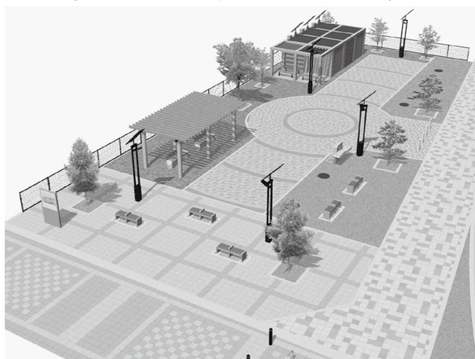
▲防災公園のイメージ

平成27年6月臨時会は6月18日に、9月定例会は9月1日から17日までの17日間開かれ、固定資産評価審査委員などの人事案件4件を同意・適任としました。他に工事請負契約や条例改正、平成27年度補正予算などの議案12件を可決しました。また、議員より安民法制に関する意見書が提出され、審議の結果、可決されました。(議案審議の結果は8ページに掲載) 平成26年度各会計決算認定7件は、決算特別委員会を設置し、慎重に審査した結果、全て可決・認定しました。(審査内容は4〜7ページに掲載) なお、9人の議員が一般質問を行い、町当局の考えをいただきました。