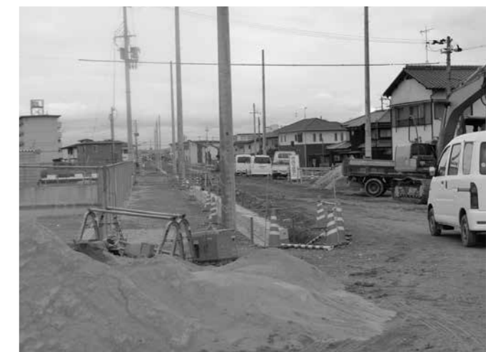
▲順調に進む浜幹線道路

平成25年8月臨時会、9月定例会における議案審議の結果や内容の経過・経緯などの説明を行いました。 参加者からは、議案や町行政に対する質疑がありました。また、多くの意見・提言をいただきました。有意義な報告会となりました。報告会での意見・提言の一部を紹介いたします。 より詳しい内容は議会ホームページに掲載しています。