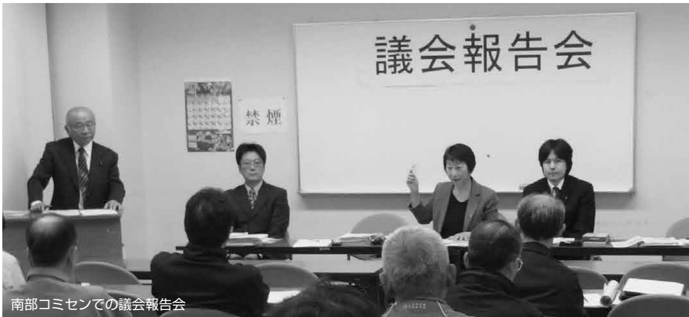
南部コミセンでの議会報告会