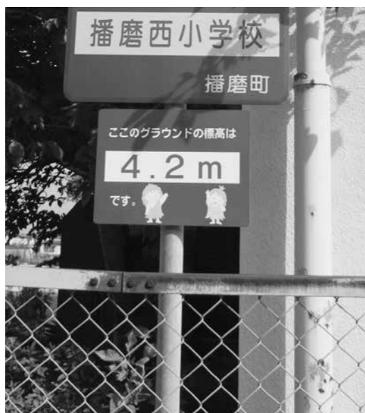
▲避難の目安である標高表示板

Q 例えば、相生市は新婚世帯に家賃補助をしているが、播磨町も何か特色を出していくようなことをやっているのか。 A 子育てに力を入れている。この辺りでは中学校給食をしているのは播磨町だけである。