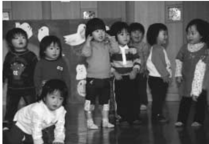
▲病気になっても安心してお医者さんにかかれるように