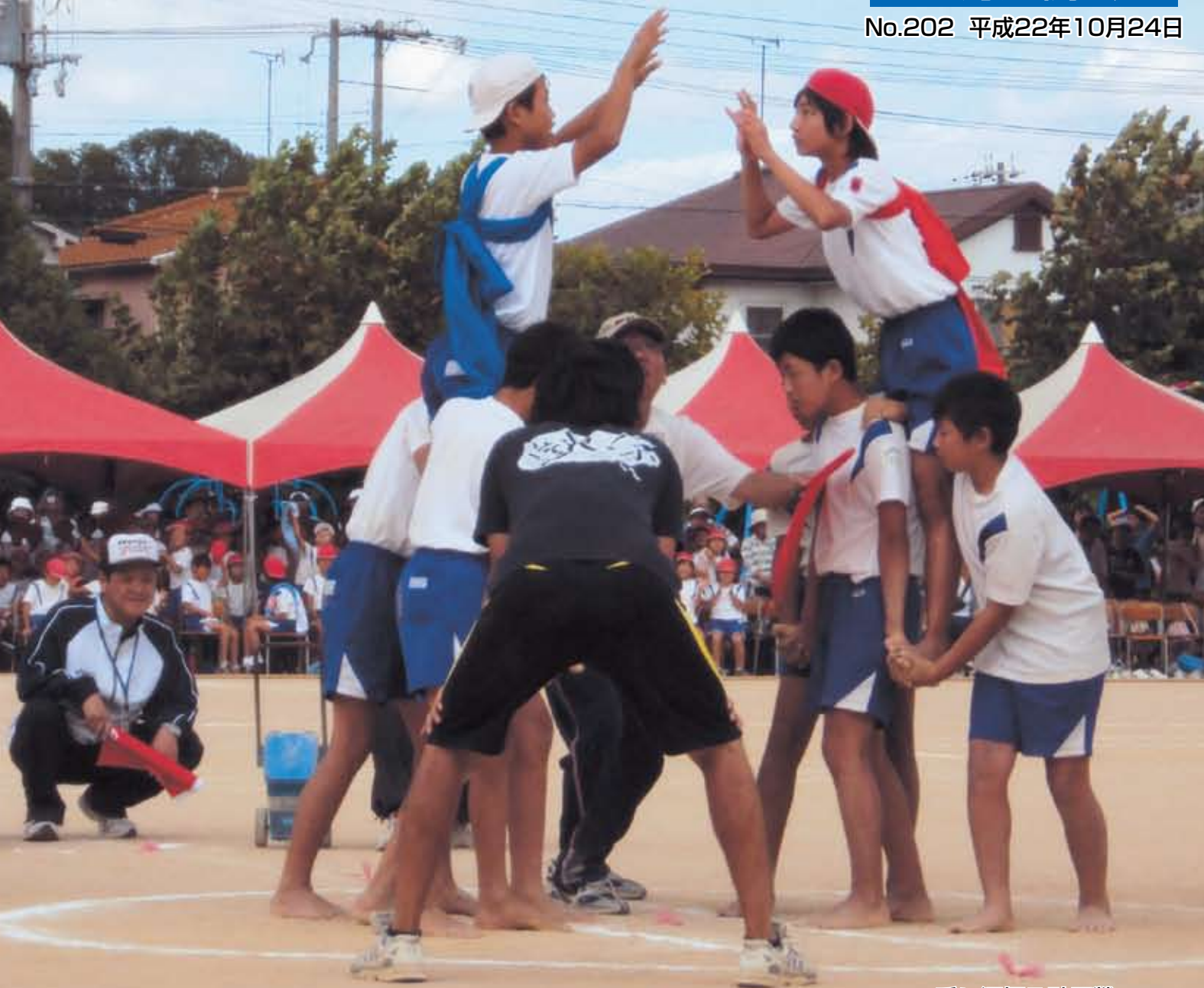
手に汗握る騎馬戦 (蓮池小学校)