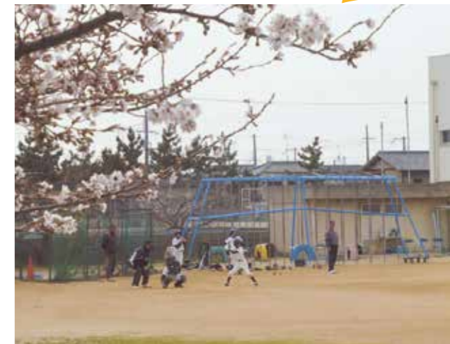
▲桜が見守る球春の頃(蓮池小学校)