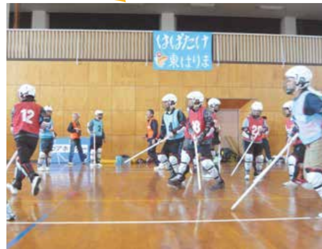
▲ユニバーサルスポーツ交流会でのフロアホッケー