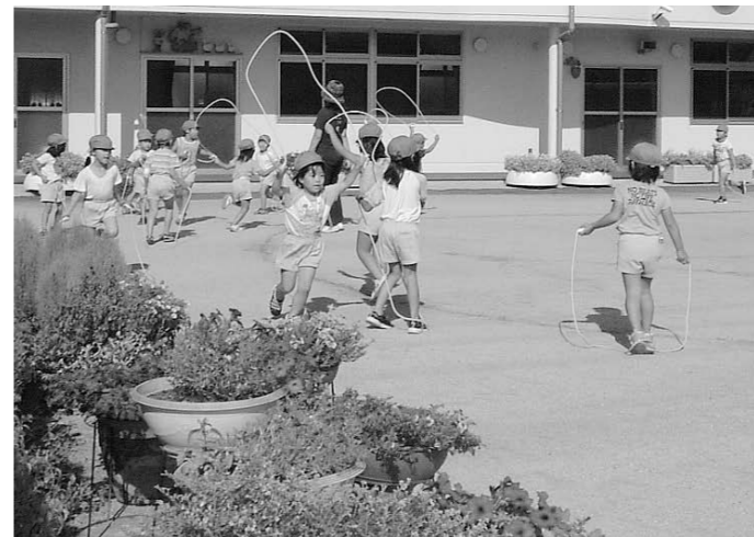
▲安全・安心で心豊かに育つ子どもたち

広報10月号で周知をはかると共に感染すれば重症化の恐れがある妊婦などにマスクの配布も予定しており、感染拡大の抑制に万全を期したい。