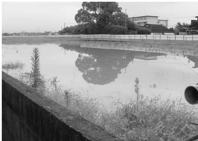
▲新住宅地の大量の雨水排水は古宮雨水幹線へ

古宮地区のダイワボウ社宅跡地37,000㎡に住宅が開発分譲される予定であるが、雨水排水路はどうなるのか。 当該開発予定地には、以前は「堂の谷川」が存在していた。この開発予定地の雨水排水は「堂の谷川」に排水放流するの