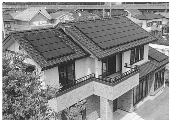
▲太陽光発電によるクリーンエネルギーの活用を