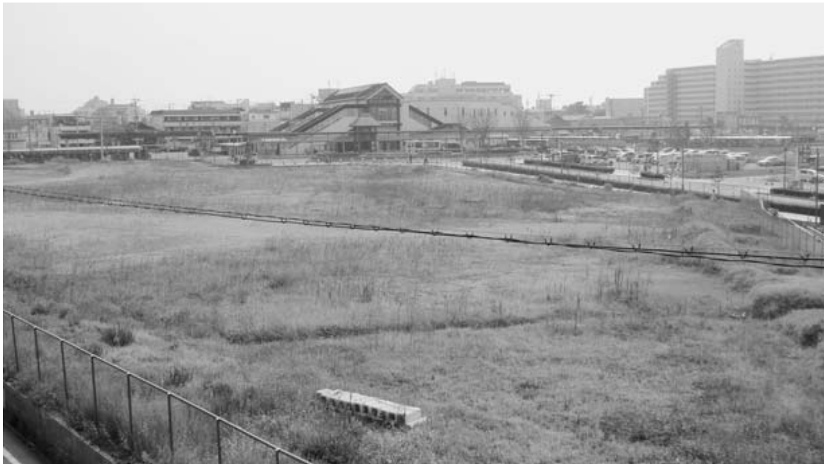
▲(仮称)土山駅南複合交流センター建設予定地

1月16日、2月25日、3月27日に臨時会が開会されました。 1月と2月の臨時会に提案された(仮称)土山駅南複合交流センターの実施設計に要する補正予算をいずれも否決し、住居表示整備事業 における2議案の内、1件を可決、1件を否決しました。なお、請願については、請願趣旨の一部を採択しました。 また、廃止の議決をした条例が3月臨時会で再議に付され、法定の同意が得られなかったため、廃案となりました。