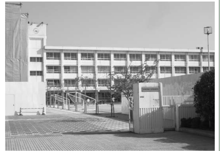
▲廃校が覆らなかった旧播磨北小学校

答 平成12年度を基準として平成19年度までに温室効果ガスを15%削減すべく達成している。