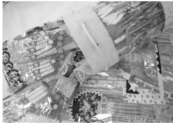
▲花火はマナーを守って安全に