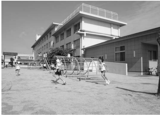
▲全児童の放課後の居場所づくりを推進すべき

6月定例会は8日、9日の両日、9人の議員が一般質問を行い、町政全般にわたり町当局の考えをいただきました。